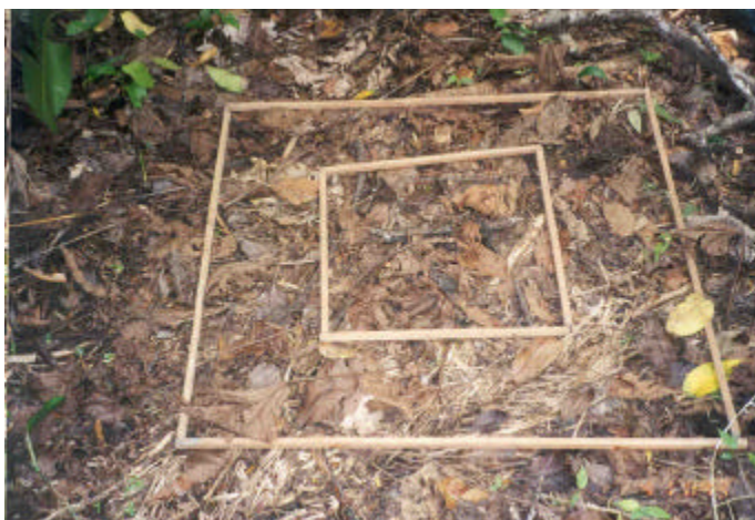
Fig. 4. Quadrantes de 1 x 1 m e de 0,5 x 0,5 m para determinação da biomassa da serrapilheira.

Para estimar o carbono armazenado neste material, marca-se dentro dos quadrantes de 1 x 1 m, um subquadrante de 0,5 x 0,5 m (Fig. 4). Nele coleta-se toda a serrapilheira e registra-se o peso fresco total acumulado, em 0,25 m 2 . Desta amostra, retira-se uma subamostra e se registra seu peso, colocando-a em saco de papel devidamente codificado e enviada ao laboratório para ser secada em estufa a 75°C até obter-se peso seco constante.