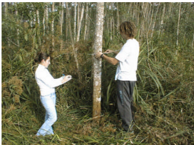
Fig.1 Medida de diâmetro na altura do peito

Para estimar o carbono armazenado na biomassa arbórea viva, marcam-se ao acaso 5 parcelas de 4 x 25 m, onde se realizam o inventário florestal, medindo-se a altura com aclímetro e o diâmetro na altura do peito (DAP) de todas as árvores com 2,5 até 30,0 cm de DAP, empregando-se a fita diamétrica (Fig.1).