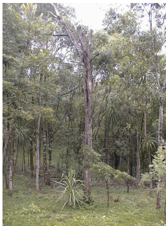
Fig. 5. Árvore morta e sua biomassa.

A biomassa das árvores mortas em pé é estimada tanto nas parcelas de 4 x 25 m como nas parcelas de 5 x 100 m de acordo com o DAP das árvores, de forma similar a estimação da biomassa arbórea viva (Fig. 5).