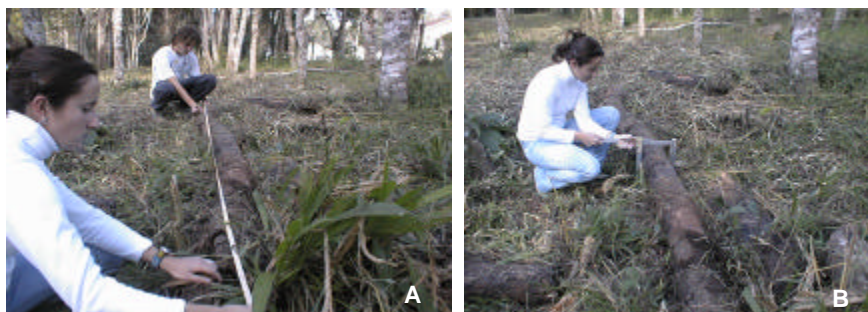
Fig. 6. Biomassa de árvores caídas mortas registrando-se o diâmetro (A) e o comprimento (B) dentro do sistema de uso da terra com o bracatinga

Se a árvore caída atravessa a parcela, somente registrar o comprimento da parte compreendida dentro do quadrante.