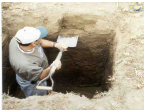
Fig. 7. Trincheira para amostragem de solo (A) de solo e horizontes para determinação de carbono e da densidade aparente (B).